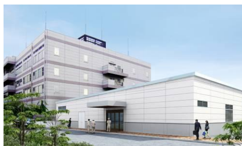
专用工厂的示意图