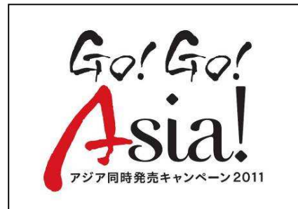
在亚洲市场使用的促销图标

在此次促销期间，基于统一图标“Go! Go! Asia!”的相同 POP 招贴将出现在每一个国家，以此表示在整个亚洲地区开展的此次促销。电视商业艺人 Shiori Kutsuna 将在日本和台湾的节目中出现，同时也会在其他地区门店内外的视频显示屏上播出。