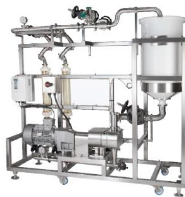
脂质体量产设备 效果图