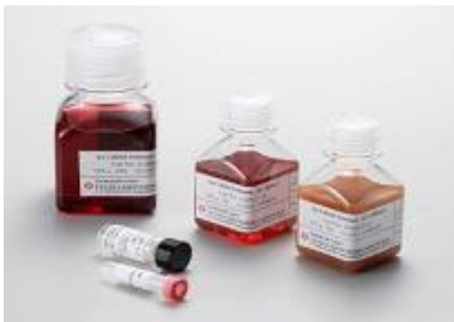
시약에 사용되는 금 콜로이드

현행의 혈액 중에 존재하는 ZIKV 검출방법으로 특별한 설비를 필요로 하는 유전자 증폭법 (※6) 이 이용되지만, 검출에 반나절에서 하루 정도의 시간이 필요합니다. 하지만 본 시약은 검체를 시약에 침투시키는 것만으로 ZIKV 검출이 가능하고, 또 이미 실용화되어 있는 인플루엔자 바이러스 검출 시약과 마찬가지로 10~15 분 정도의 단시간에 손쉽게 검출할 수 있습니다. 또한 유전자 증폭법과 같이 특별한 설비를 필요로 하지 않기 때문에 사용자의 비용도 절감할 수 있습니다.