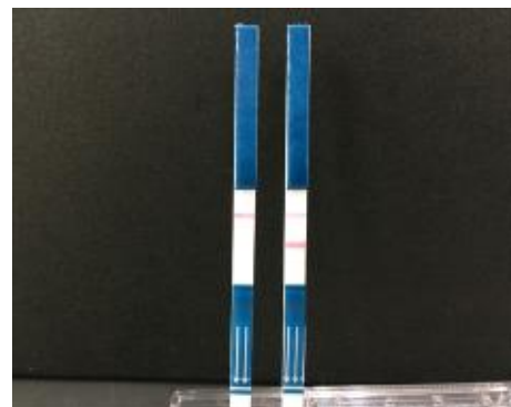
검사 시의 사용 예 (왼쪽이 음성, 오른쪽이 양성 반응을 보이고 있습니다. 바이러스를 검출하면 두 개의 선이 나타납니다.)