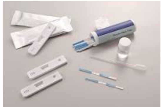
다나카귀금속공업에 의해 고객에게 출하되는 검출시약 시트