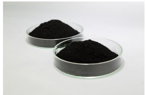
<PEFC 용 전극 촉매>

현재, 다나카귀금속공업의 쇼난 공장내의 FC 촉매 개발센터에서는 고체 고분자형 연료전지(이하 PEFC)의 전극 촉매를 개발, 제조하고 있습니다. PEFC는 연료전지 자동차(이하 FCV)나 가정용 연료전지 '에네팜' 등에서 사용되고 있으며, 나아가 앞으로는 FC 버스 등의 상용차나 FC 지게차 등의 산업 기계 분야에서도 사용 확대가 기대되고 있습니다. PEFC는 소형 경량으로 고출력을 발휘할 수 있으며, 수소와 산소의 화학 반응을 이용한 지구에 부담이 없는 새로운 에너지 기술입니다. 다나카귀금속공업에서는 오랜 세월 키워온 귀금속 촉매 기술 및 전기화학 기술을 집결해 PEFC의 캐소드(공기극)용으로 고효율인 백금 촉매를, 애노드(연료극)용으로 내일산화탄소(CO) 피독 특성이 뛰어난 백금 합금 촉매를 개발하고 있습니다.