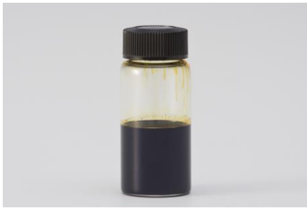
【低溫燒結銀奈米墨水】

本項技術在智慧型手機的觸控面板與有機 EL 顯示器等用途上，對薄型化、軟性化及高畫質化做出貢獻。