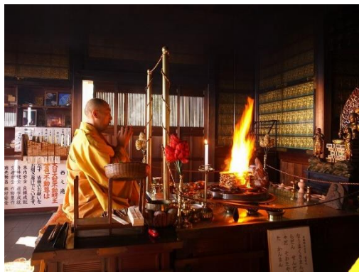
具靈性的護摩梵燒體驗