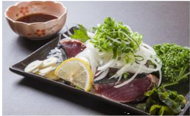
推薦「炙燒鰹魚半敲燒」