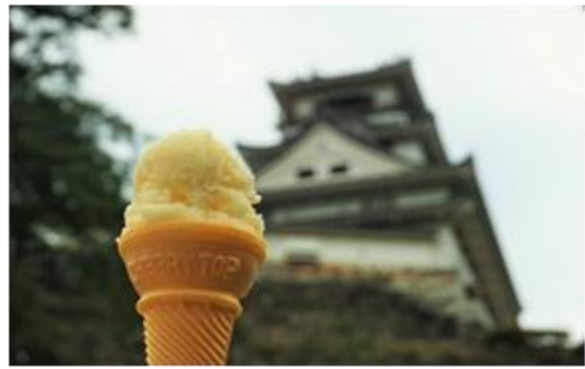
以高知名產「老式冰淇淋」來小休片刻