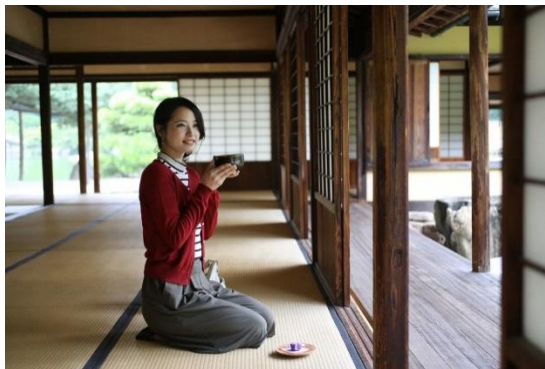
在掬月亭休息片刻吧