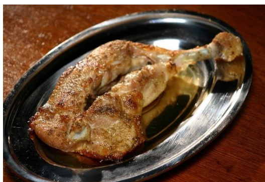
品嚐看看帶骨雞腿吧？