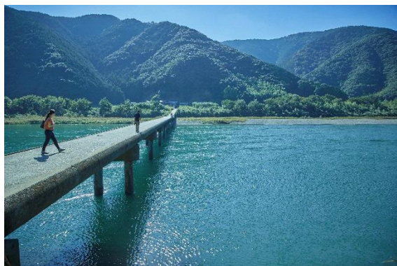
四萬十川和沉下橋

因為面向太平洋。擁有「鰹魚半敲燒」「清水鯖魚」等，可以享盡海之美味食材。此外，近年深入國外注目的四萬十川，本流沒有設立大規模的水庫，因此又稱做為「日本最後之清流」美名。欲在四萬十川周邊散步的話，可以租借自行車或觀光遊覽船等服務。皮划艇或慢筏等也能享受河川邊玩耍之樂趣，可以提供眾多各種不同享樂四法十川的玩樂方法。