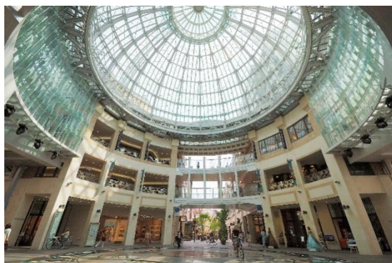
丸龜町商店街的圓頂廣場