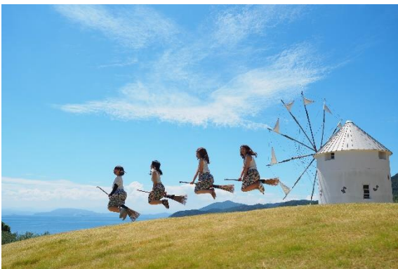
在橄欖樹公園跳躍！

能享受望向有著「世界的寶石」之稱的瀨戶內海的多島美及隨風飄過的橄欖樹，在島內騎著自行車，或在四季分明多彩多姿的登山步道中健行，在望向小豆島景色的天空進行靈性的護摩梵燒體驗等多項戶外活動。參觀具有舊有文化的製作醬油時所使用的大型桶具後，可一嚐醬油之鄉所製作的醬油或以酒釀調味的小豆島海鮮及以傳統素材製作所製成的手打素麵，進行特別的島上之旅吧！