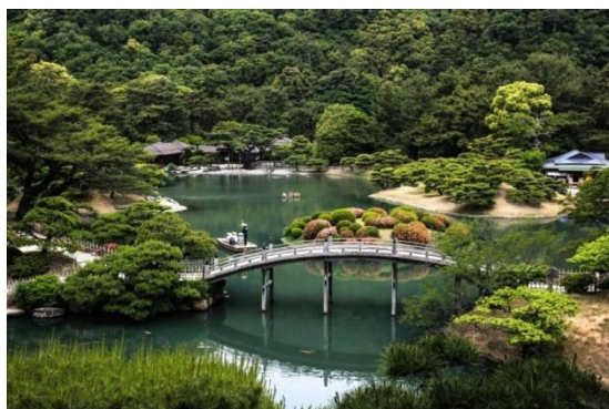
「庭院國寶」從栗林公園飛來峰上眺望

當然，來到香川，必吃美食一定就屬讚岐烏龍麵了！口感 Q 彈有嚼勁，搭配吃法也相當眾多。習慣全服務性質的店家的話，可以試著挑戰自助式店家。