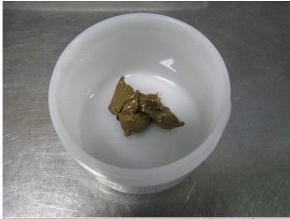
胶状“ AuRoFUSE™ ”的外观