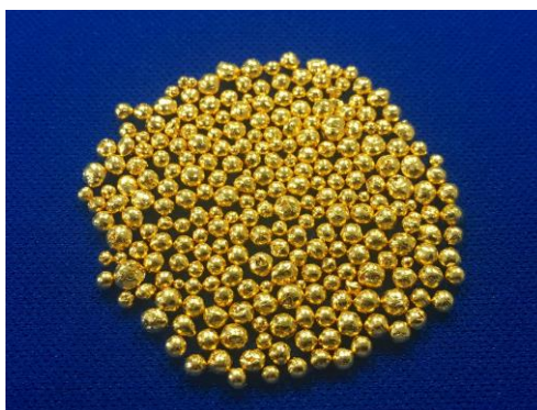
【高质量 Au 蒸镀材料“SJeva”（粒状）】

由于本蒸镀材料具有以上的特点及优势，在半导体领域内的细微配线、MEMS，以及光学装置、LED、医疗设备等的使用蒸镀材料制成的最终产品中，有望对提高终端用户的生产效率、降低成本做出贡献。