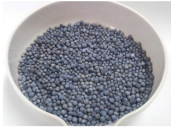
개발한 입상 소수성 백금 촉매(입자 직경 3mm)

일반적으로 방사선에 비해 약한 고분자로 제작되던 신형 전환로 후겐의 중수 정제에 사용한 실적을 가진 종전 제품에 비해 본 제품은 2 년의 기간 동안 1kg 당 9 조 베크렐의 트리튬을 포함한 물을 연속 처리한 경우의 선량에 상당하는 530kGy 의 방사선 조사에 대해서도 성능에 대한 영향이 없습니다. 또한, 일반적으로 내열성이 약하고, 조건에 따라서는 불에 타서 부서질 가능성이 지적되던 고분자를 사용하던 종전 제품에 비해 본 제품은 통상 사용 온도인 70℃를 크게 웃도는 600℃ 이상의 내열성을 확인하였습니다. 이렇게 트리튬 안전을 담당하는 시스템에의 적용에 있어서 우려되던 각종 문제를 본 제품은 해결하였습니다. 또한, 트리튬과 수증기 간에 수소 동위체를 교환하는 효율이 촉매 부피당 종전 제품의 약 1.3 배(세계 최고)인 것을 보여주고 있습니다. 이것은 같은 성능을 얻는 데 촉매량이 종전 제품의 3/4 이면 된다는 것을 의미합니다. 본 촉매를 액상 화학 교환 프로세스에 적용시킴으로써 트리튬수 중의 트리튬 농도를 높일 수가 있어 효율적인 트리튬수로부터의 트리튬 회수가 가능합니다. 또한, 본 촉매를 필요로 하는 트리튬수로부터의 트리튬 회수에 대해 비용적으로도 유리합니다. 트리튬수로부터의 트리튬 회수 시스템은 본 촉매의 개발에 의해 실증을 위한 큰 기술적 장벽을 넘을 것이라는 전망을 얻었습니다. 본 촉매 기술에 대해서는 원자력기구와 TANAKA 귀금속공업주식회사에서 특허를 공동 출원한 상태입니다.