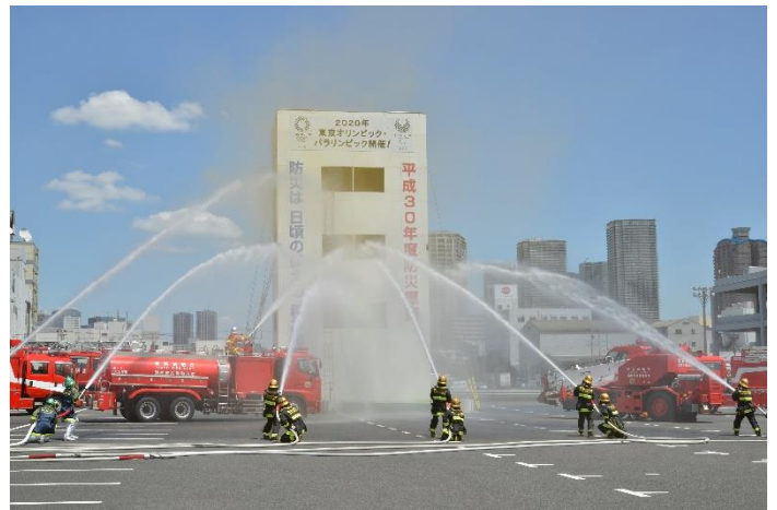
上一届展会（2018年）的情形

作为展会期间的主要展示内容，东5、6、7展厅将分为“灭火、急救、救援、疏散和诱导”、“防灾、减灾、灾害对策”、“信息系统、通信服务”、“其他消防防灾相关产品与服务”这4个领域，另外还将开设特别企划展区——“应急电源专区”的企业展示区域及东京消防厅区域的室内展示空间，向广大来客介绍在火灾及灾害中保护人身安全的最新技术与备受瞩目的产品。作为主办方项目，企业展示区域内还将进行美国海军日本辖区司令部消防队和日本自卫队东京地方合作总部的展示（仅限6月17日和18日）。