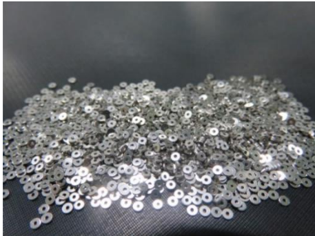
백금 이리듐 합금 X 선 불투명 마커